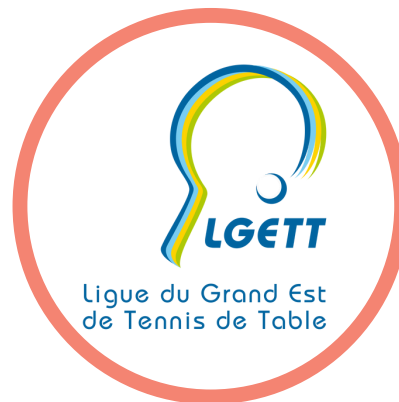
La Ligue du Grand Est de Tennis de Table

Le Tennis de Table connaît une progression remarquable. La saison dernière, le nombre de licences a atteint son plus haut niveau dans le Grand-Est en culminant à 19 000, chiffre jamais atteint auparavant. De plus, le réseau des clubs dans la région continue de s'étendre avec plus de 290 clubs affiliés, renforçant ainsi la dynamique et l'attrait de ce sport pour un public toujours plus large. Cette croissance témoigne de l'engagement des clubs et de l'intérêt croissant pour le tennis de table dans la région, qui se positionne désormais comme un pôle majeur du développement de ce sport en France.