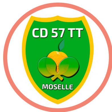
Le Comité Départemental de la Moselle